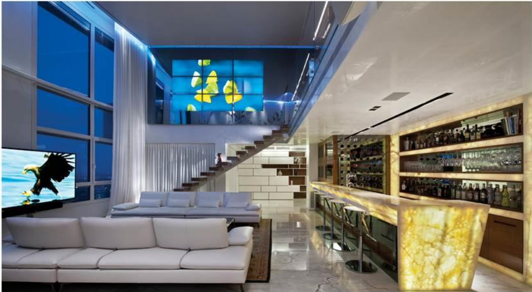
Autre décor, autre ambiance